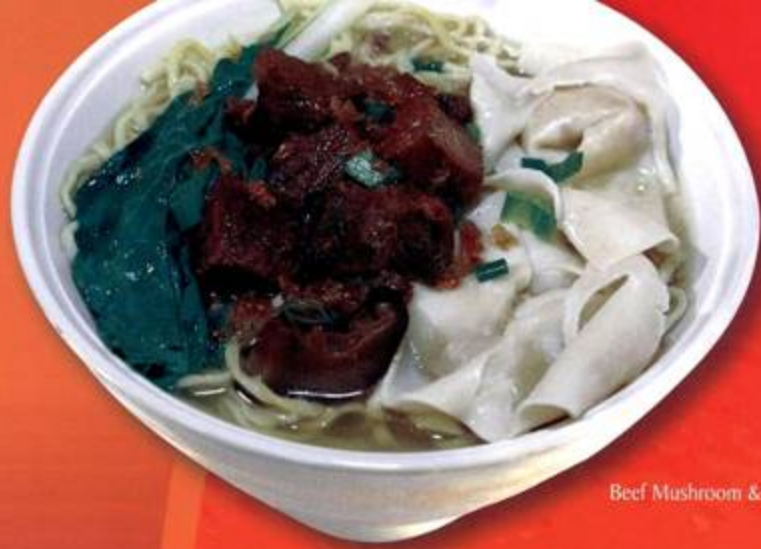
Beef Mushroom & Wonton