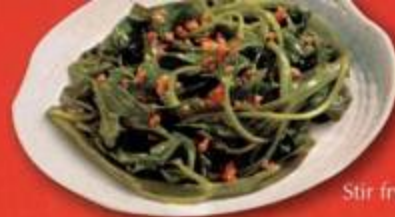
Stir fry Kangkong