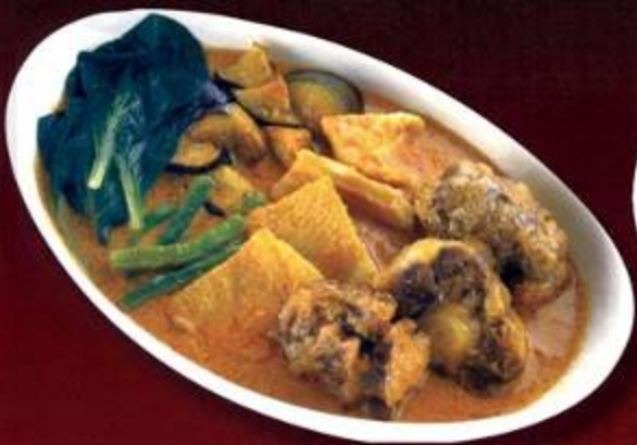
Ox Tail & Tripe in Peanut Sauce