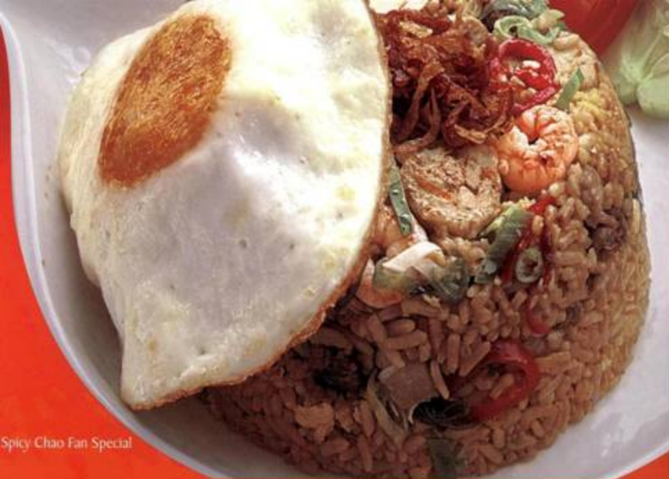
Spicy Chao Fan Special