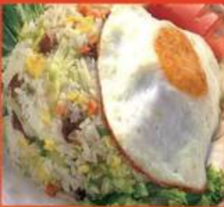
Yang Chao Fried Rice