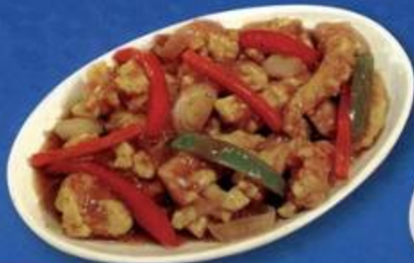
Fish with Black Pepper Sauce