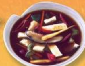
Hot & Sour Soup