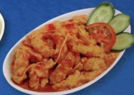
Honey Chilli Crispy Fish