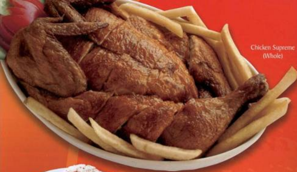
Chicken Supreme (Whole)