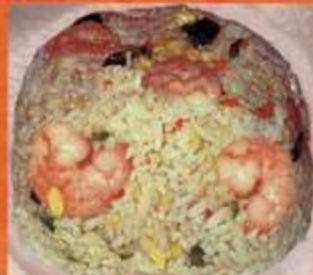
Shrimp Chao Fan