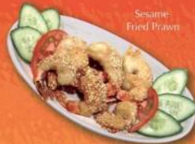
Sesame Fried Prawn