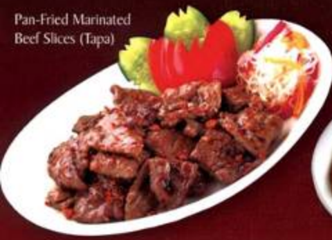
Pan-Fried Marinated Beef Slices (Tapa)