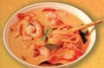
Tom Yum Kung