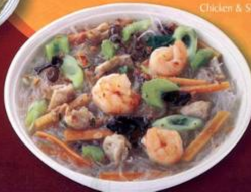
Chicken & Shrimp Vermicelli