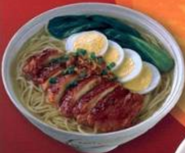
Chicken Char Siu