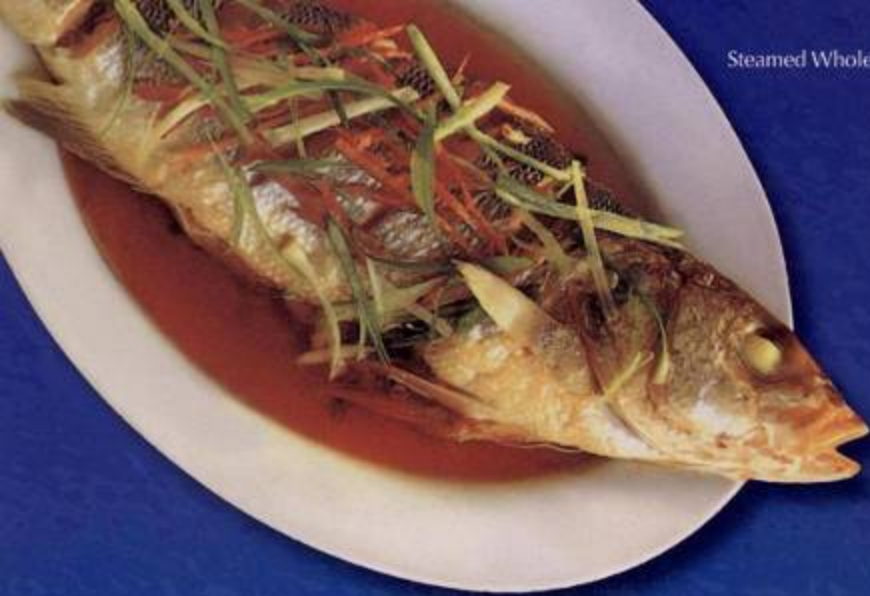
Steamed Whole Fish