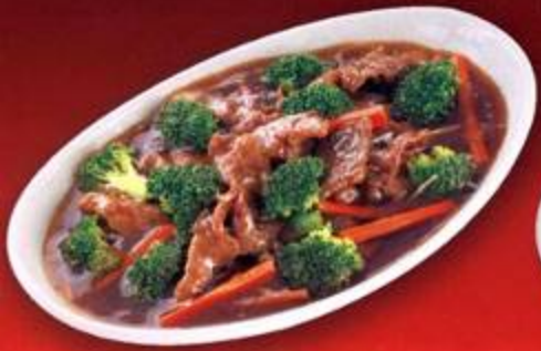
Beef with Broccoli