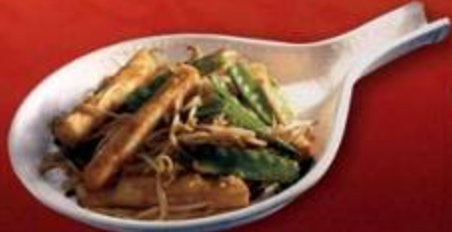
Chinese Vegetables in Peanut Sauce