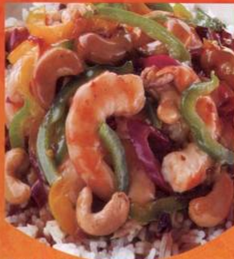
Shrimp Kung Pao