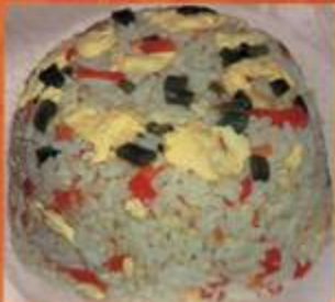
Egg Fried Rice