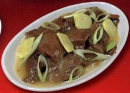
Beef with Ginger and Leeks