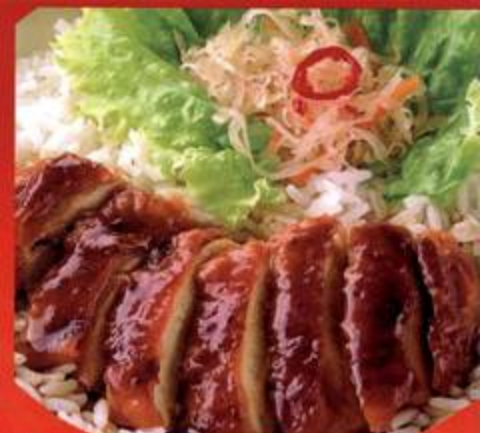
Chicken Char Siu Rice