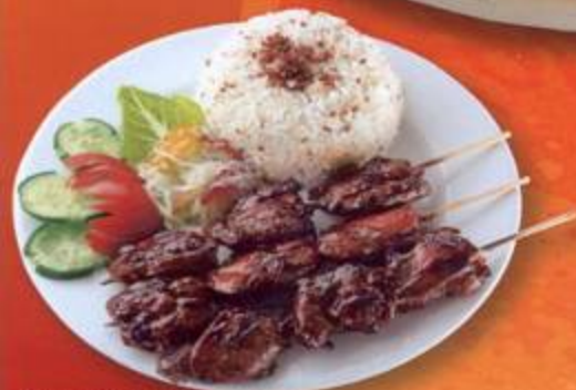
Chicken Barbeque (3 sticks) with rice