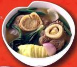
Beef Shank w/ Vegetables (Bulalo)