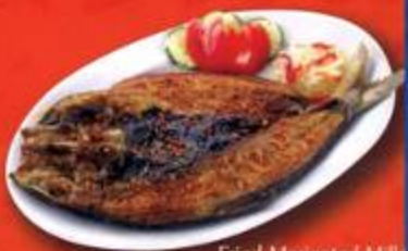
Fried Marinated Milkfish (Daing na Bangus)