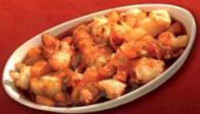
Crispy Vegetables in Sweet & Sour Sauce