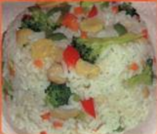
Vegetables Chao Fan